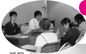
写真上は、班別交流