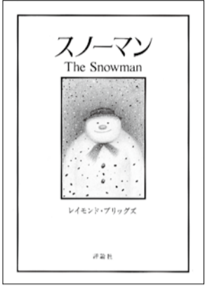
「The Snowmanゆきだるま」レイモンド・ブリッグズ1978 「スノーマンThe Snowman」レイモンド・ブリッグズ1998 共に評論社