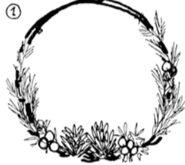
コニファー や松ぼっくりなどのかざりつけをしようと思ふ材料を仮置きして、レイアウトを考える。