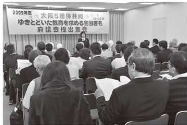
集会で各団体のとりくみを交流 (国民会館)