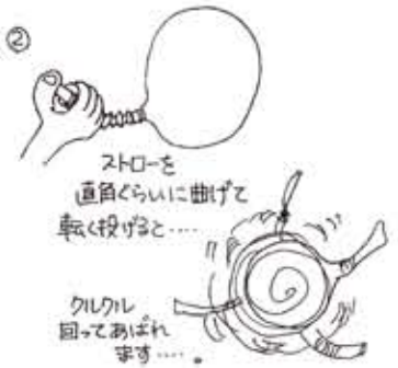
ストローを 直角くらいに曲げて 軽く投げると……