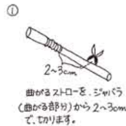
曲がるストローを、ジヤバラ (曲がる部分)から2~3cm で、切ります。