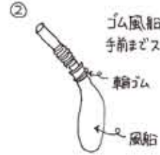
ゴム風船の口に 輪ゴムを巻いて 止めます。

① 輪ゴムを強く 巻きすぎると、ス トローがつぶれる ので、気を付けま しょう。