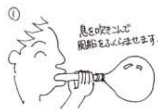
息を吹きこんで 風船をふくらませます。