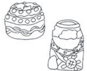
✂カッタ 荒木 智子(岸和田市立山道北小)