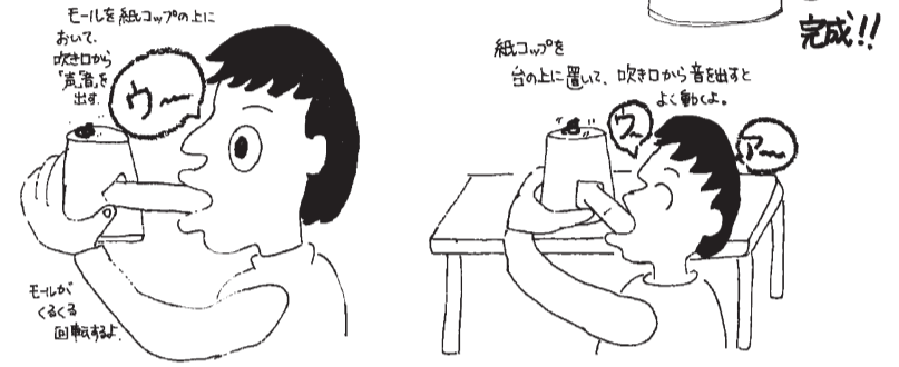
手ごもつても、台に置いてもいい。紙コップに絵をかいたり、モールに絵をかいたりしてもあもしろいよ。