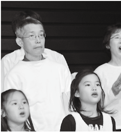
「いずみ愛と平和のコンサート合唱団」は5歳から大人まで、幅広い市民に支えられている

「子ども支配」になり、配らないか、ふりかえりが必要。今、子どもと教職員の間が、心から信頼しあえる関係になっているのか、マニュアル化やHOW TO的になっていないかが問われます。