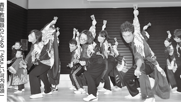
教育のついで大阪2010(第60次大教組教育研究集会)

「子ども支配」になり、配らないか、ふりかえりが必要。今、子どもと教職員の間が、心から信頼しあえる関係になっているのか、マニュアル化やHOW TO的になっていないかが問われます。