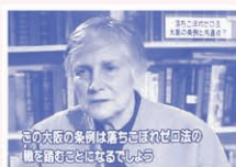
2月16日毎日放送「VOICE」より

「アメリカは失敗したのです。ですから、日本がその過ちを繰り返すのは悲しいです」(アメリカの教育改革「落ちこぼれゼロ法」を作ったラビッチ教授 2月17日 MBS「VOICE」)