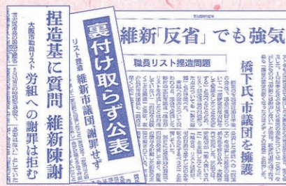
▲二セの内部告発問題を報道する各紙

二セの内部告発を利用し、大阪市の職員を通じて、一般市民のことまで調査した橋下市長と「維新の会」。市民に対して謝るべきです。