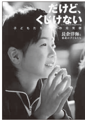
『だけど、くじけない』 長倉洋海と東北の子どもたち

東北で被災し大阪に転校してきた中のY君が、三学期の終業式を迎えていました。一年間の大阪生活を終えて、まもなく故郷に帰るのです。Y君は毎日必ず図書室にやってくる。次々に面白そうな本をみつければ、むさ