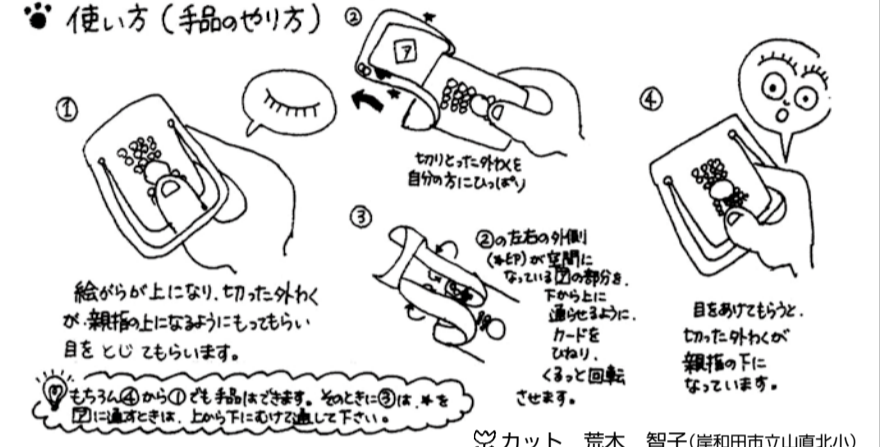
カット 荒木 智子(岸和田市立山直北小)